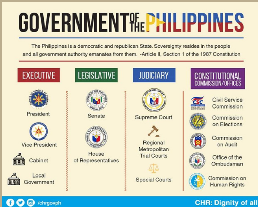
Fig. 2 Mga sangay ng gobyerno ng Pilipinas na idinisenyo para sa "checks and balance"